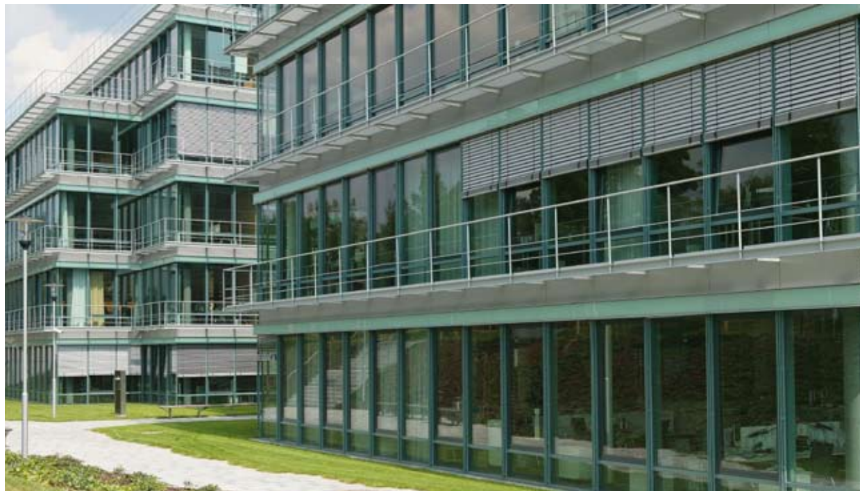
← Campus, Kronberg Ausführung: MULTIPACT®

Bei der Prüfung für angriffshemmende Verglasungen wird zwischen vier Angriffsarten unterschieden. Deshalb gibt es MULTIPACT® in vier verschiedenen Standards: